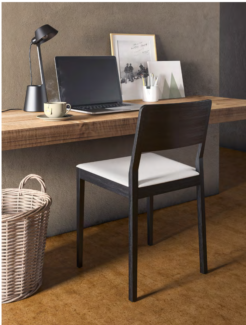
Sedia SEIDA design Odo Fioravanti

Tutti i designer sono a caccia dell'archetipo e per la tipologia sedia si tratta di una ricerca quanto mai difficile. La Seida che è proprio un nome nato da un refuso di scrittura, indaga nella sua semplicità ed essenzialità assoluta, il concetto di sedia in legno ridotta alla sua essenza.